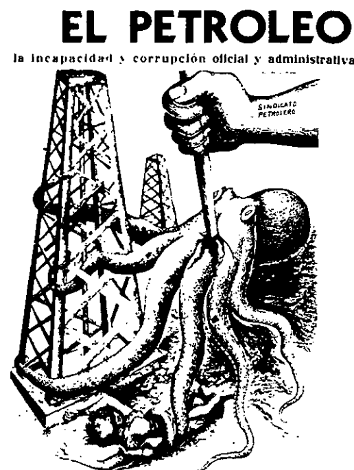
la incapacidad y corrupción oficial y administrativa

l'armée, tantôt sur les syndicats et les mobilisations populaires. Son programme vise le développement industriel, notamment par la substitution des importations, et l'expansion du marché interne. Cela peut conduire à des frictions et conflits avec l'oligarchie terrienne et la mise en œuvre de réformes agraires partielles (Mex-